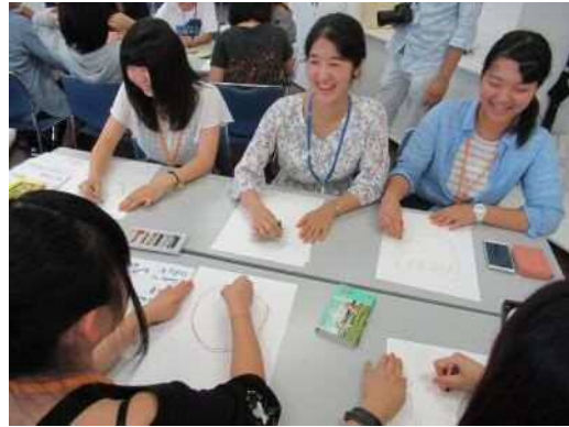
2名1組のペアでお互いの似顔絵を描いている様子