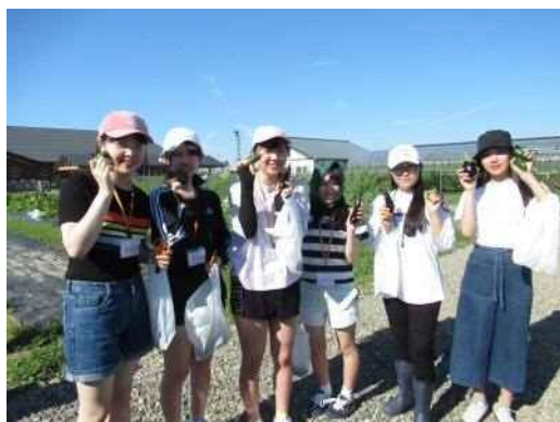
トマト・ナスなどの夏野菜を収穫体験