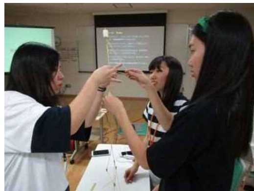
パスタとマシュマロ等で高さを競うゲーム