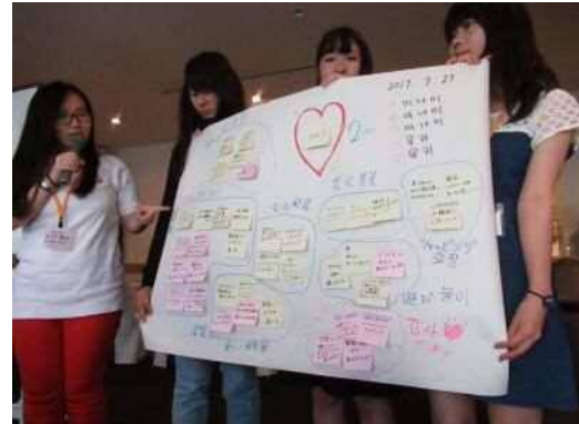
グループ代表による発表の様子