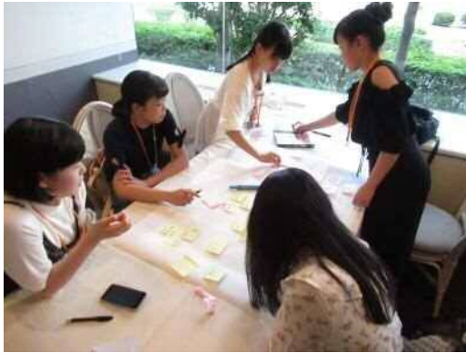
グループ内でのまとめの様子