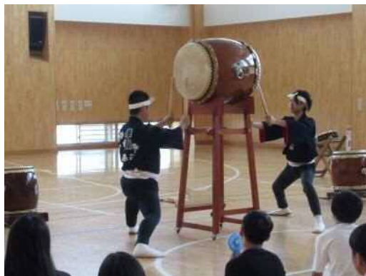
講師による演奏披露

・万代太鼓華龍の皆さんの指導の下、新潟の伝統芸能「万代太鼓」の体験を実施し、直接文化に触れることで本市の文化への理解を深めた。