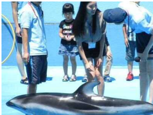
イルカとの握手に挑戦