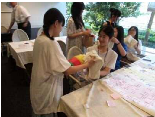
プレゼント交換の様子