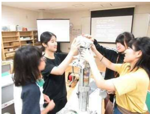
新聞紙で高さを競うゲーム

・2都市混合のチームでゲームを行い、お互いにコミュニケーションをとりながら、相互理解を深めた。